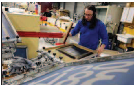
L'entreprise est née du marquage d'équipements sportifs.