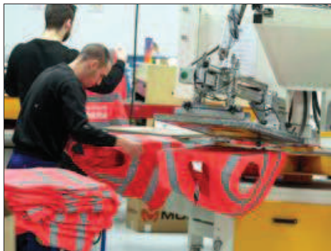
Grosse série que ces 3000 gilets marqués « Pénibilité », pour la CGT.