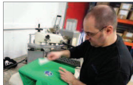
L'activité de Sericenter nécessite une main-d'œuvre importante.